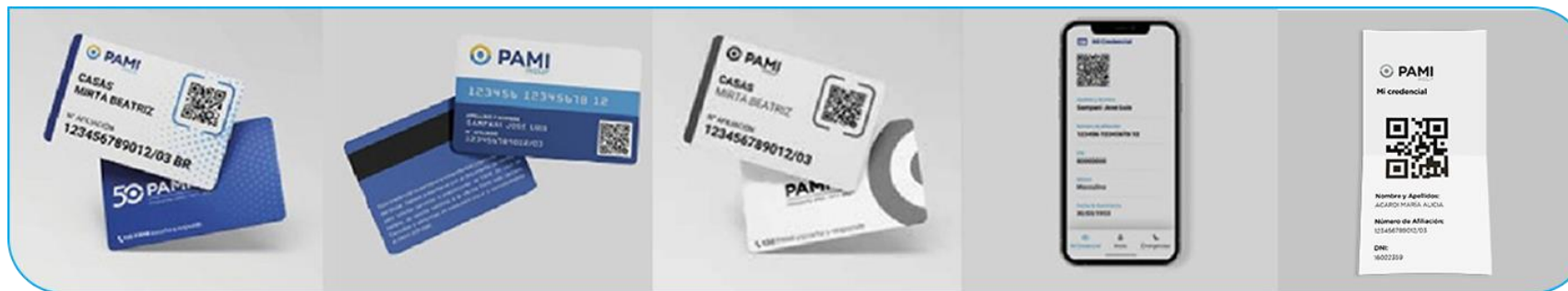
Credencial plástica o magnética

Recuerde que existen cuatro tipos de Credencial de afiliación válidas y vigentes, y puede validar la prestación escaneando el código QR de cualquiera de ellas.